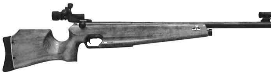
ビームライフル ジュニア用 型式 MBR-203J

この銃は 3.0kg と軽量で、全長も小中学生などに合わせた入門者向けのモデルです。 バットプレートは体格に合わせて、前後に調整できます。 バッテリー、サイトセット、ハードケースが付属します。