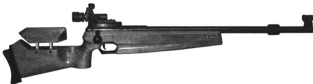
ビーム・ライフル 型式 MBR-201

この銃は 3.0kg と軽量で、全長も小中学生などに合わせた入門者向けのモデルです。 バットプレートは体格に合わせて、前後に調整できます。 バッテリー、サイトセット、ハードケースが付属します。