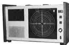
ディスプレイ装置 型式 MD-201L