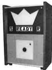
ターゲット装置 型式 MT-201