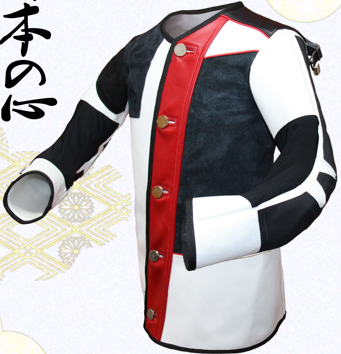
インパルスモデル